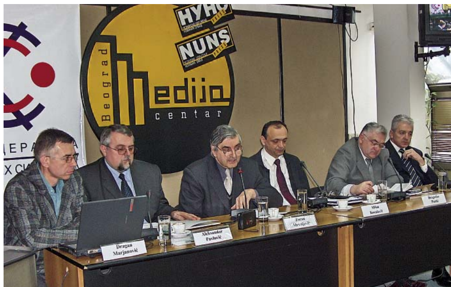
Са конференције за штампу КСС

град. Садржај плаката, са сликама локалних народних посланика (нарочито оних који су гласали против), чине тачни подаци како је гласао сваки од њих. Грађани имају право да знају ко им је директно избио