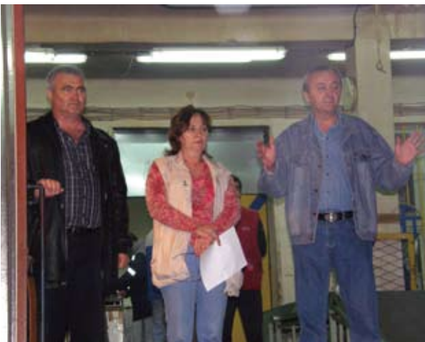
Организатори протеста у Новом Сагу

Репрезентативни синдикати и генерални директор договорили су се и да у најкраћем могућем року