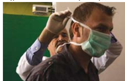
Заштитијте себе и друге

Укратко, суочавамо се са веома озбиљним „противником“. Опасност коју са собом носи овај злоћудни ви-