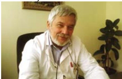
Слушајте савешће лекара

Стручњаци указују да је сезонски грип респираторна заразна болест изазвана хуманим вирусом инфлуенце (А и Б) и јавља се у епидемијама, а заразност је највећа одмах по настанку симптома и најчешће траје пет дана, код деце до седам дана. Симптоми сезонског грипа су повишена температура – изнад 38 степени, болови у мишићима, кашаљ, цурење носа или његова запушеност.