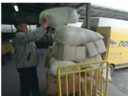
Претїовар їакеїїа у ГПЦ-у

Претовар пакета у ГПЦ у ПЦ-у, Претоварној тачки... да ли је потребно бројање истих и евидентирање у Статистици? Да ли је то обухваћено шифром 1022-1023 односно 1024? Усмерење пакета у приспећу – Усмерење ЛЦ пош. у прет. тачки односно