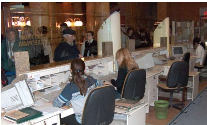
Честіа дилема: Који од уіуіуісїава и ї правилника їримениїи

Знамо да се пређени пут рачуна на петосатној достави. Потребно је омогућити да поштоноша може да испоштује радно време и са рејона се врати сходно путном листу (осим у изузетном случајевима) неколико пута месечно – када су поделе новчаних дознака или велике количи-