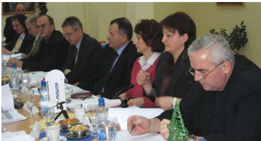
Детаљ са седнице Управног одбора Предузећа

краћена за приход од закупа имовине коју користи Телеком, а то је приближно једна седмина пословног прихода. Треба такође узети у обзир и дивиденде на које смо се задњих година навикли и које су део нашег укупног прихода. У том смислу сам и тражио на последњој седници Управног одбора податке о некретнинама Поште Србије, степен укњижбе, податке о томе шта је све у поштанској функцији, а шта не. Места за забринутост има, али како год се завршила ова ствар са Телекомом, основни задатак руководећих структура Поште је повећање прихода Предузећа.