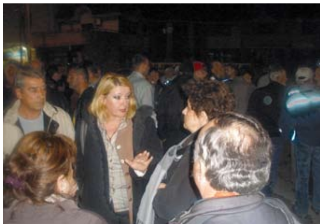
У Нишу се дежурало целу ноћ

отпочну преговоре са надлежним министарствима око утврђивања масе средстава за зараде у оквиру доношења Плана пословања за 2010. годину. Покренута је и иницијатива да се побољшају услови рада у прерадним центрима, а кренуло се и са дефинисањем проблема у