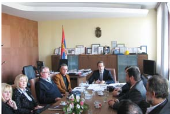
Делегација КСС-а у разговору са министром Љајићем

Одбора за утврђивање репрезентативности и републичког Социјално-економског савета. Министар је додао да је дошао