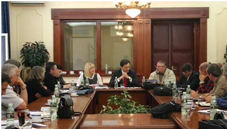
Прејегови у Шоку: Заједнички штрајкачки одбор и пословодство

На седници заједничког Штрајкачког одбора репрезентативних синдиката у Јавном предузећу ПТТ саобраћаја „Србија“, одржаној 29. октобра, донета је одлука да се на-