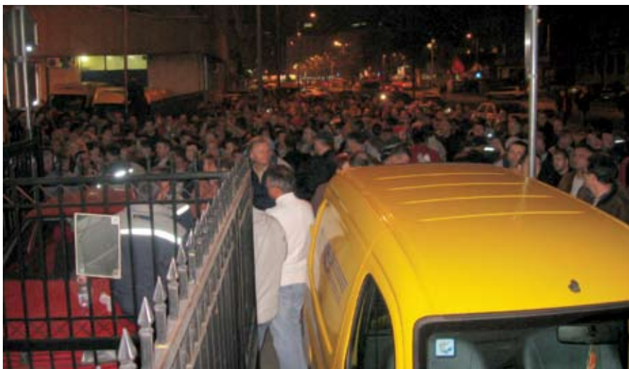
Први дан протеста: Радници блокирају улаз у ГПЦ Београд

Једно је сигурно – није морало да буде тако. Није морало да дође до ескалације радничког незадовољства и за то, пре свега, одговорност лежи на пословодству компаније. Радници Поште већ дуже времена своје радне обавезе испуњавају у потпуности, а третирани су као грађани другог реда од стране своје државе, од стране свог власника – Владе Републике Србије. Некако смо се већ навикли и прихватили чињеницу да живимо у транзиционом друштву и да смо, не својом кривицом, уплетени у велику економску кризу која се, за велико чу-