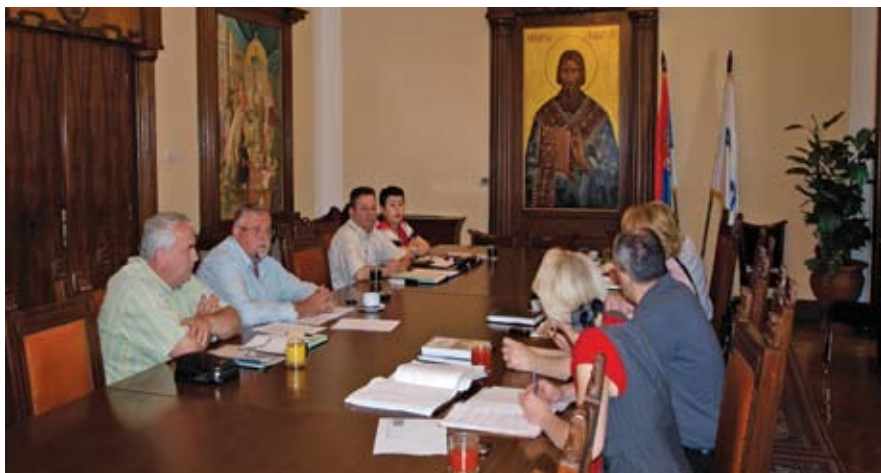
Завршена прва фаза: Комисија за колективно преговарање

У члану 55 Колективног уговора речи „места рада запосленог“, замењују се речима „седишта организационог дела у коме је запослени распоређен (радна јединица, ди-