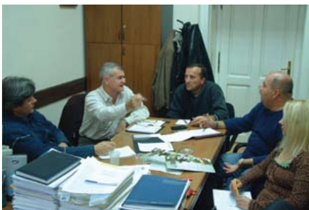
Пуно йосла: Комисија за технолојију Регије I

Као прво, члан 68 Закона о раду је више него јасан и он каже да се за послени не може одрећи права на