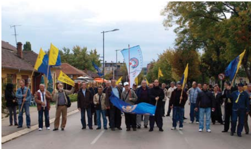
На радном задатку: Чланови Главног одбора у Бору

Окупљени су поручили да одбијају предложени Закон о изменама и допунама Закона о пензијском и инвалидском осигурању, јер се њи-