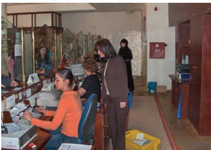
Најад на контролоре: Питамо се – ко је следећи?

У разговорима са њиховим синдикалцима сазнали смо да је овакав начин рада изазвао много проблема. На наше питање како тај читав пројекат функционише у стварном животу одговор је био – никако. Порука коју смо понели је била више него јасна: „Немојте да дозволите да вам наметну модел који доноси само проблеме!“