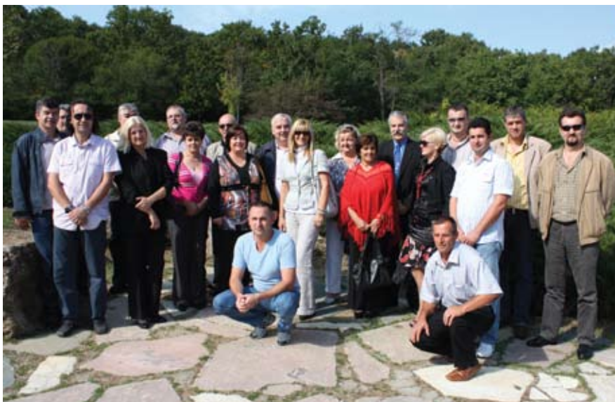
Слика за усйомену: Чланови реионалне скуйшћине Реије III у сйомен йарку Шумарице

Калајановић је нагласио и да је обавеза синдиката заштита чланства од мобинга у свим радним срединама и благовремено реаговање, што ће олакшати инплементирање закона о мобингу кроз Колективни уговор. Следила је информација о отварању заштитне радионице при РЈ „Одржавање“, у којој би били упошљени радници инвалиди, којих у Предузећу има 230.