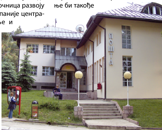
Централизовано управљање кочи развој Пошће

Пословодство би се бавило глобалном политиком, технолошком унификацијом, односима са оснивачем, али и другим поштанским управама. Стратешко планирање би такође