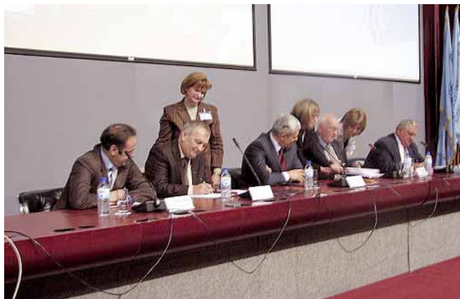
Потписивање Општег колективног уговора

динара. Лепо, нема шта, само да министар није одмах после стављања свог потписа на поменути анекс изјавио да следи постизање социјално