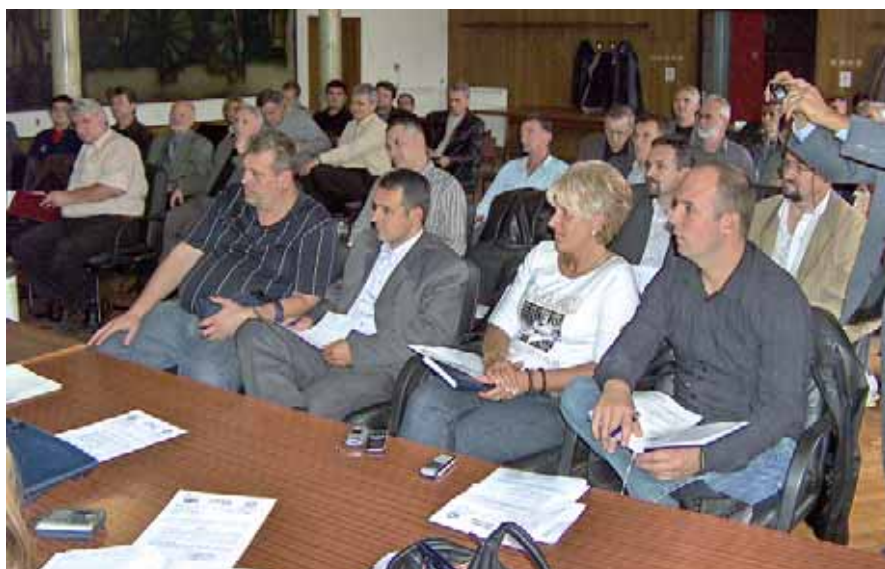
Главни одбор: Пуно поверење Извршном одбору