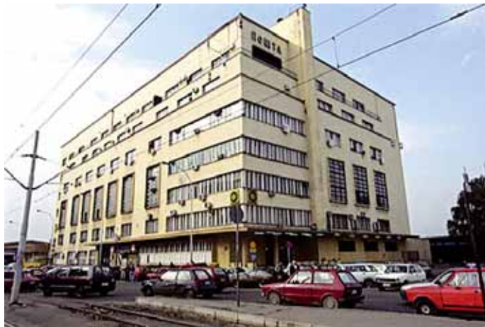
ГПЦ: Црна тачка по питању безбедности и здравља на раду

Због учесталих пљачки наших објеката, теми безбедности је посећена посебна пажња. Поред