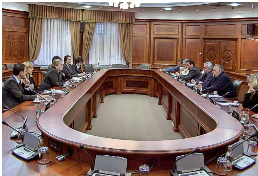
Разговори у Влади: Почетак дијалога о односу државе према ЈП ПТТ саобраћаја „Србија“

У вези са радом инспекције која контролише рад на тржишту услу-