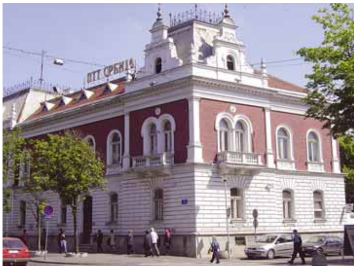
Предлој закона предвиђа постојећу нову организацију ПТТ-а

Веома је битно указати на неколико чињеница, које потенцијално могу дати негативне ефекте по даљу судбину наше компаније и запосле-